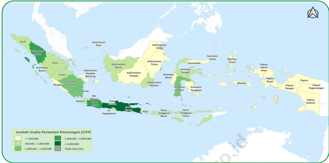
Gambar 2.1 Sebaran Usaha Pertanian Perorangan (UTP) di Indonesia, 2023 Figures Distribution of Individual Agricultural Holding in Indonesia, 2023