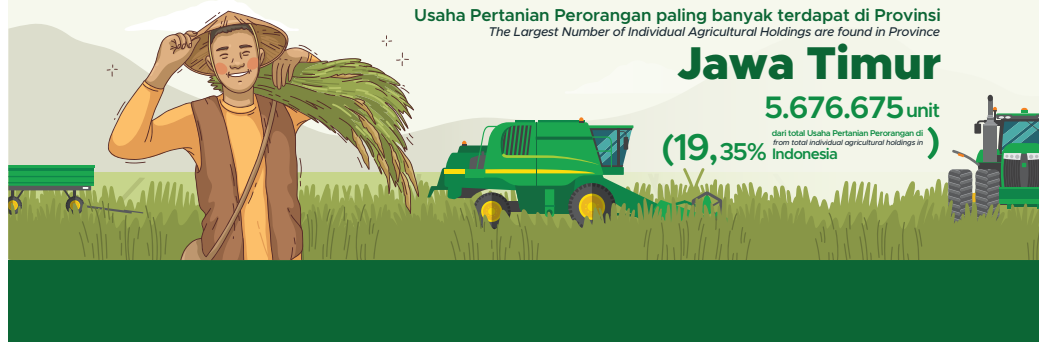
Gambar 1.2 Figures

(19,35% dari total Usaha Pertanian Perorangan di Indonesia)