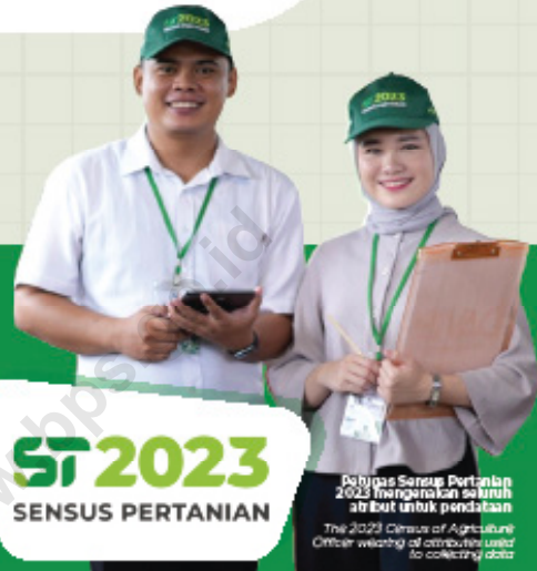
Kalangan Sensus Pertanian 2023 menggunakan seluruh atribut untuk pendataan The 2023 Census of Agriculture Officer utilizes all attributes used to collecting data