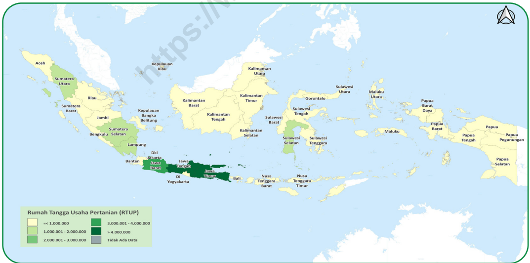
Gambar 2.4 Sebaran Rumah Tangga Usaha Pertanian (RTUP) di Indonesia, 2023 Figures Distribution of Agricultural Households in Indonesia, 2023